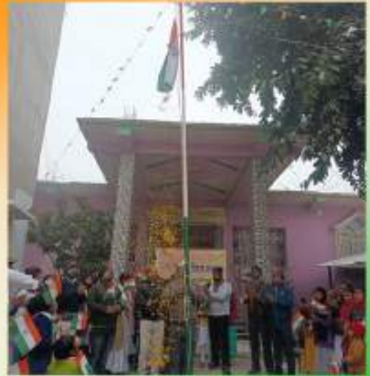
JSS, Samastipur, Bihar