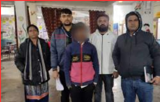
WEST CHAMPARAN, BIHAR