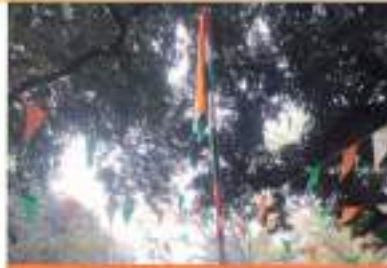
Prayas JAC Danapur