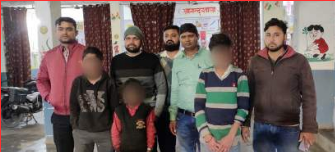
WEST CHAMPARAN, BIHAR