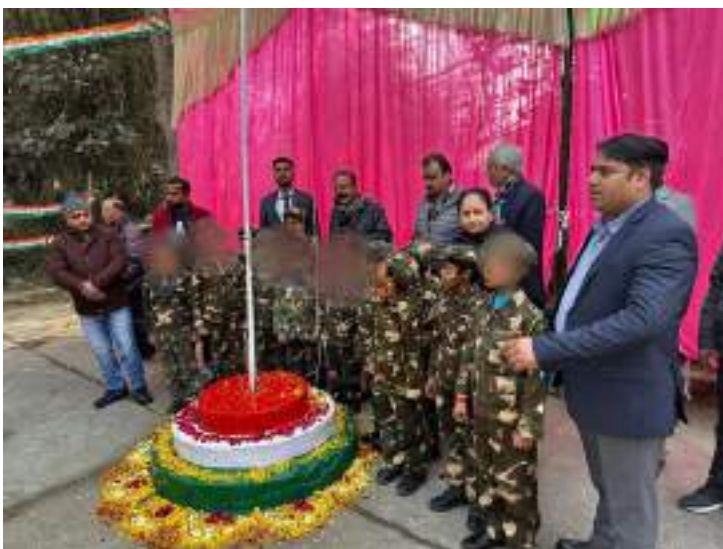
Children's Home for Boys, Jahangirpuri