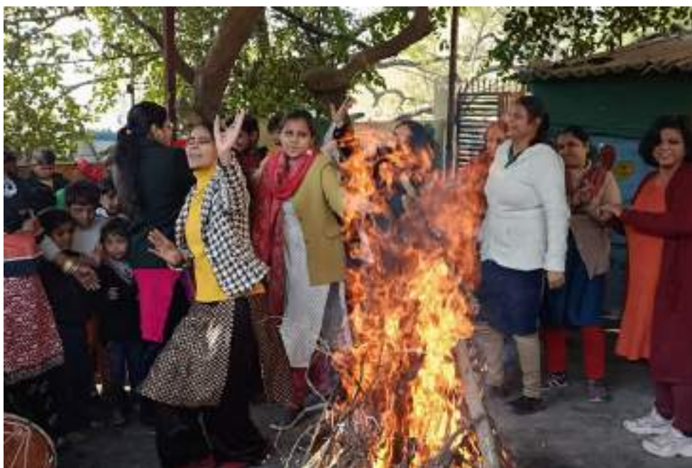
Children's Hope , Prayas

In the fire of Lohri this year, we together promised for a brighter future of all young children and prayed that the hearth of Lohri burn all the evils of our society.