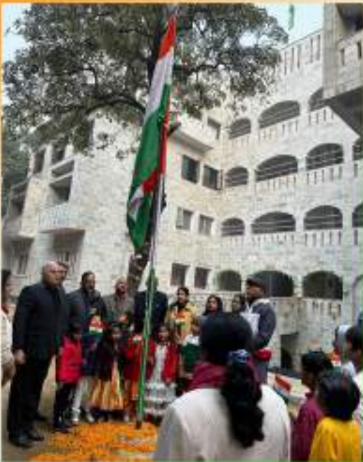
Head office, New Delhi

Glimpses from 75th Republic Day Celebration at different centres/units of Prayas spread across the country.