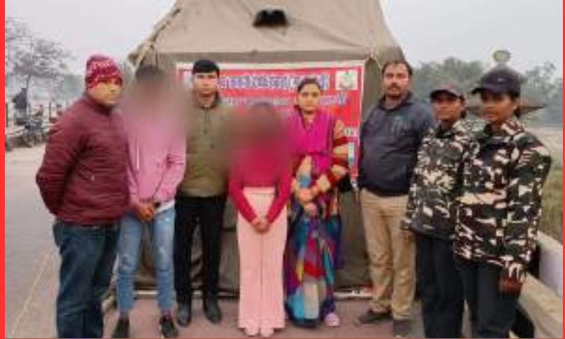
WEST CHAMPARAN, BIHAR