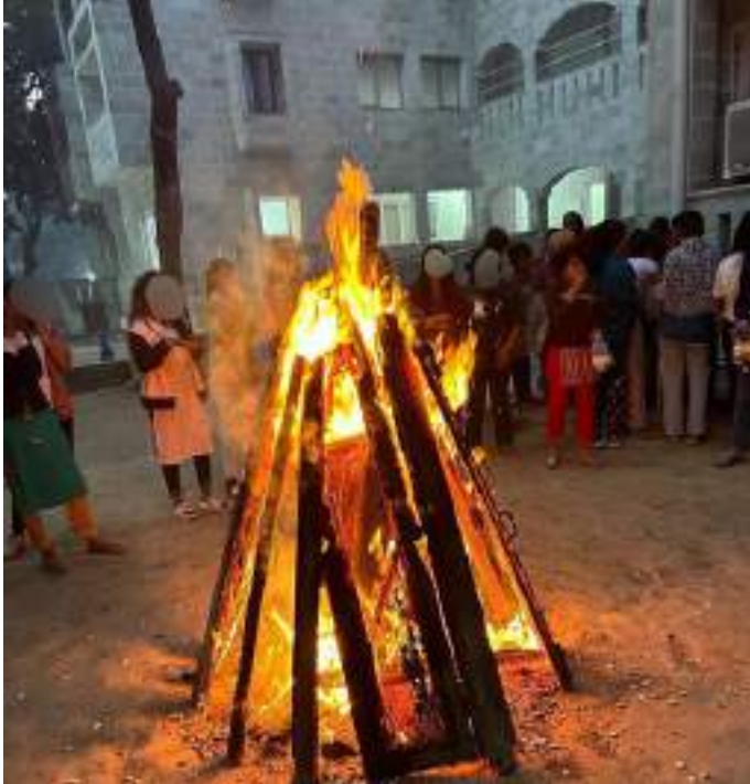
Head Office New Delhi

In the fire of Lohri this year, we together promised for a brighter future of all young children and prayed that the hearth of Lohri burn all the evils of our society.