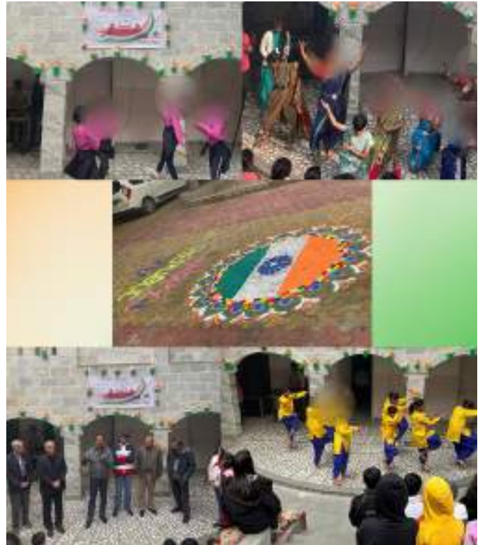
Head office, New Delhi