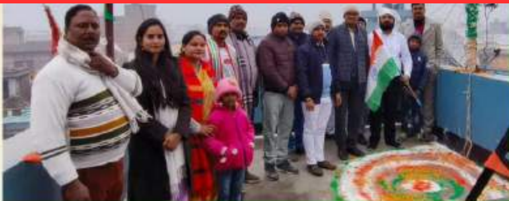
Prayas Bettiah Office, West Champaran