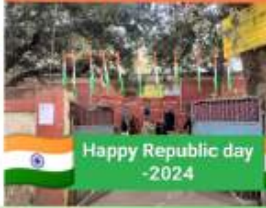
Happy Republic day -2024