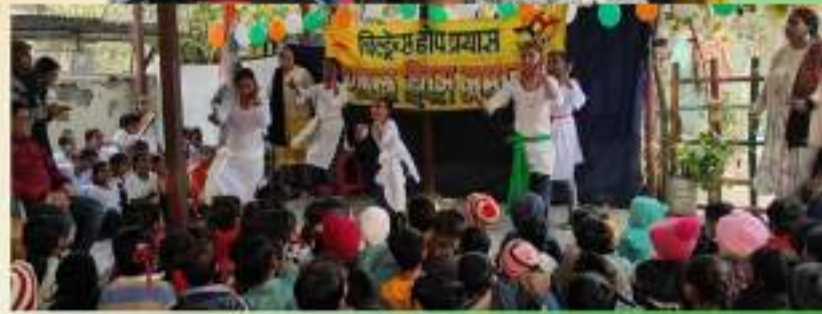
Children's Hope Prayas, New Delhi