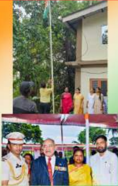
JSS, South Anandpur