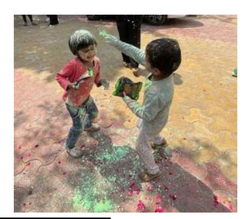
Head Office, New Delhi