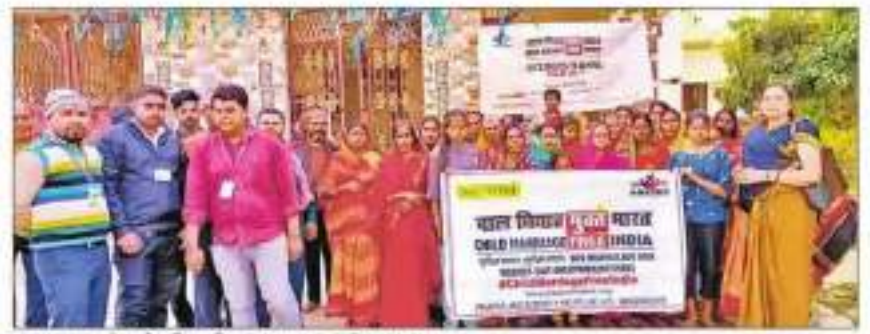
गरुवाना कार्यक्रम में प्रतिमत महित्तार व प्रचार राज्या के सदस्य,