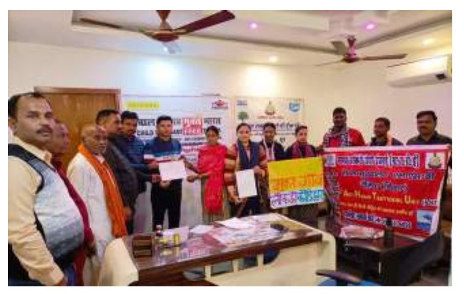
East Champaran, Bihar

Kauria Village and Laukaha village of East Champaran declared as Child Marriage Free Villages. This is a result of the awareness campaigns conducted throughout the year as part of Access to Justice Project.